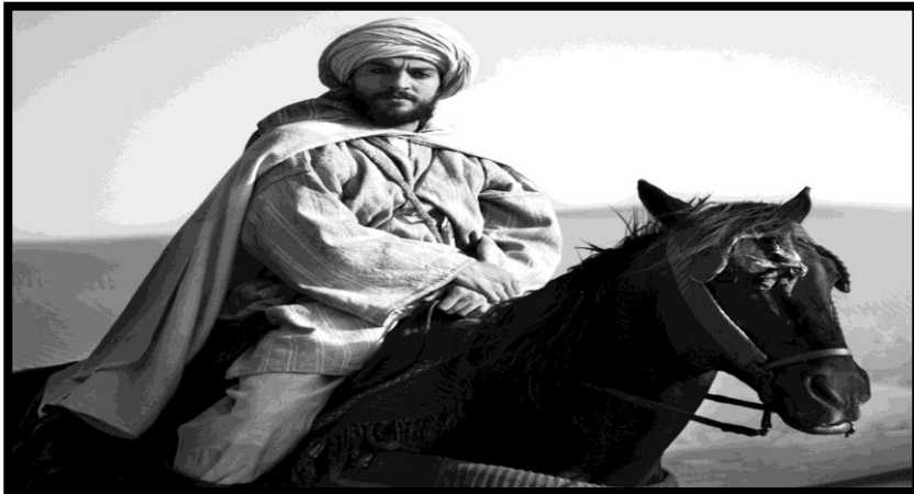
পর্যটক ইবনে বততা

তোমরা ইবনে বতুতার নাম শুনেছ নিশ্চয়ই? তিনি ছিলেন একজন বিশ্ববিখ্যাত পর্যটক। ছোটবেলা থেকেই তার ছিল বিশ্বভ্রমণের প্রবল ইচ্ছা। অথচ তৎকালীন সময়ে এ ভ্রমণের পথ মোটেই কুসুমাস্তীর্ণ ছিল না; ছিল দুর্গম ও কণ্টকাকীর্ণ। আকাশ পথ তো দূরের কথা, তখন আজকের দুনিয়ার মতো রাস্তাঘাট ও যানবাহনও ছিল না। তবুও তিনি দুর্গম পথ অতিক্রম করে সারা পৃথিবী দাপিয়ে বেড়িয়েছিলেন। মৃত্যুর মুখোমুখিও হয়েছিলেন বেশ কয়েকবার, কিন্তু থেমে যাননি। তিনি বিশ্বাস করতেন, ‘মৃত্যুভয় মানুষের স্বপ্ন ও অগ্রযাত্রাকে কখনোও রুখে দিতে পারে না।’