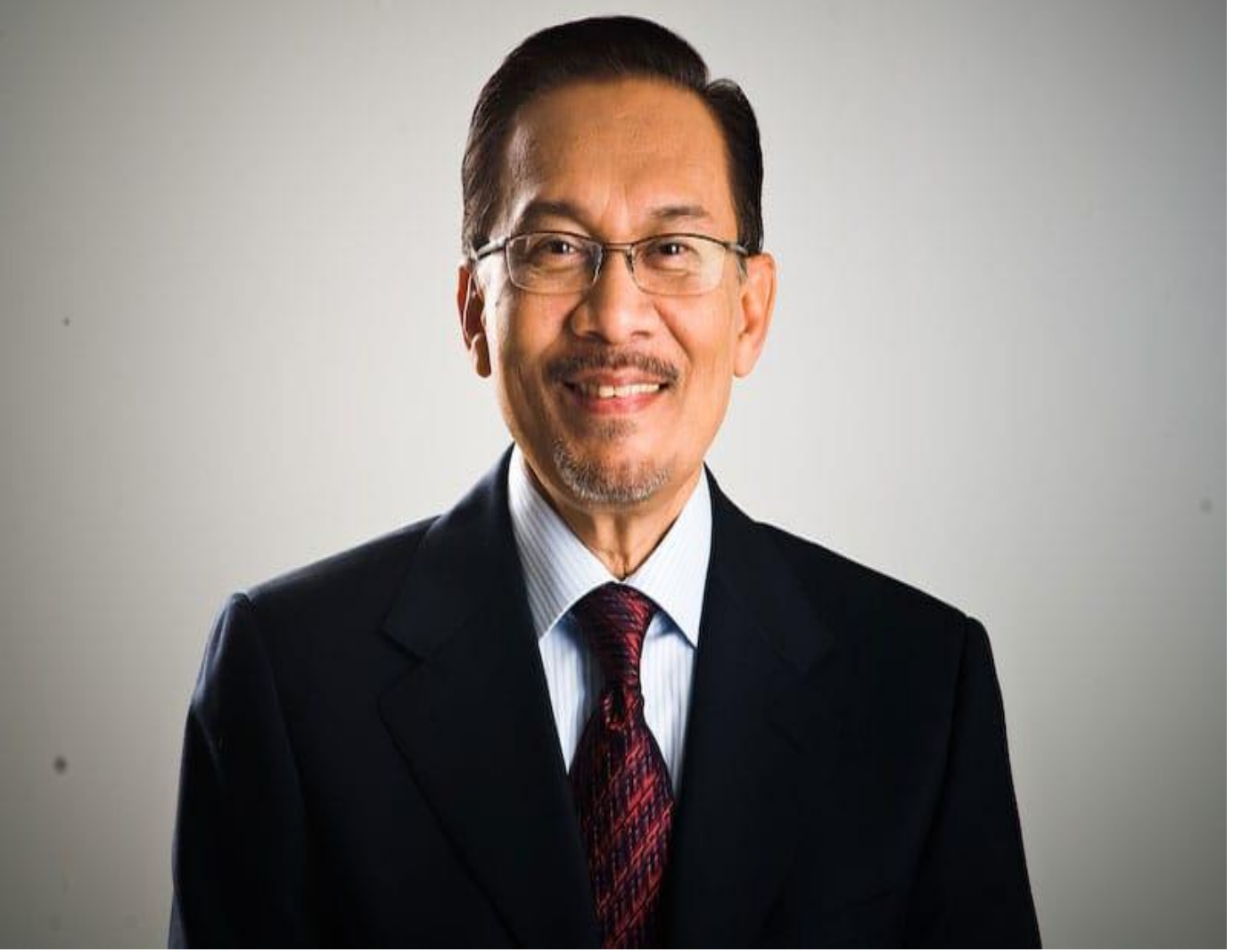
আনোয়ার ইবরাহিম : আদর্শের প্রতিচ্ছবি

ক্যামেরার ফোকাস আধুনিক মালয়েশিয়ার স্থপতি ড. মাহাথির মোহাম্মদের দিকে থাকলেও দেশ গড়ার অন্তরালের নায়ক এই আনোয়ার ইবরাহিম।